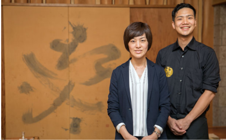
多店舗小売業 株式会社chicfeel

教職員同士の緊急連絡も可能になり、 “生徒を守るため”のスピーディかつ きめ細かな対応が実現