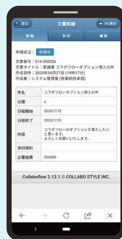
コラボフローの申請書