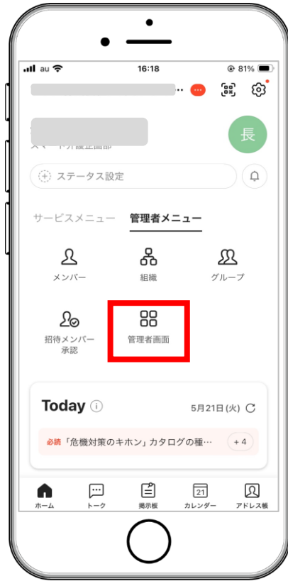
管理者画面をタップ