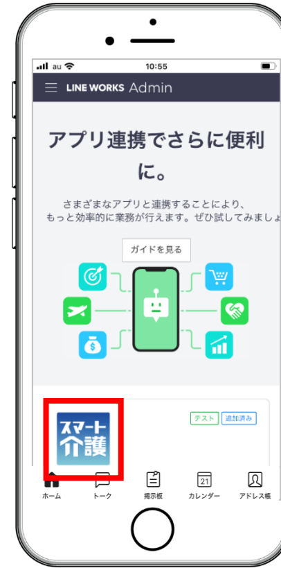
スマート介護アプリをタップ