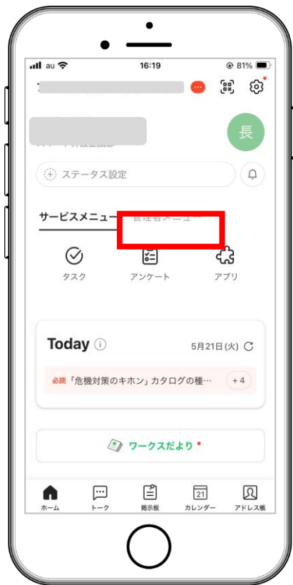
管理者メニューをタップ

管理者画面（LINE WORKS Admin画面）のアプリディレクトリ画面から「スマート介護アプリ」を選択し「LINE WORKSに追加」をタップします。