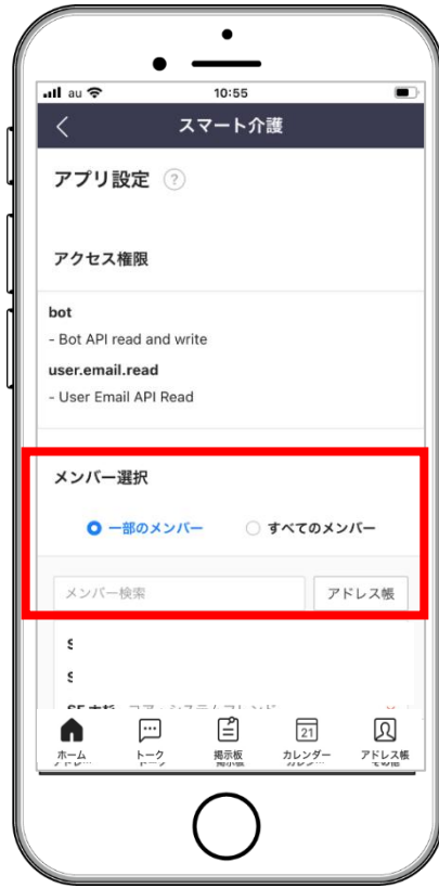
メンバーを追加する